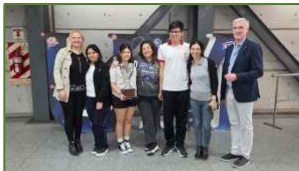
Olimpiadas de química 2025

"Los chicos, que puedan asumir desafíos, verlos que se entusiasman con la materia, pensar en que uno colabora con su formación"