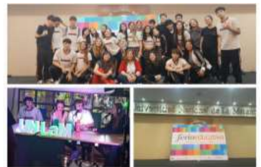
UNIVERSIDAD DE LA MATANZA

Desde la dirección se gestionan las autorizaciones de la inspectora y de los padres o tutores de los alumnos. Previamente y después de cada salida se realizan actividades en clase relacionadas con la experiencia, lo que permite a los estudiantes integrarse mejor a lo vivido.